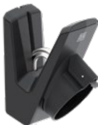
712268 - Docking-Typ 2

Fragen Sie Ihren Händler nach der Auswahl von eConnect Zubehör.