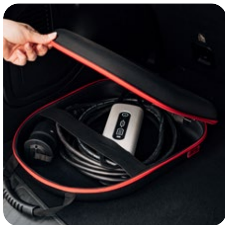
712594 - Premium-Tasche

Für weitere Informationen kontaktieren Sie die DEFA unter +49 175 40 61 64 7 oder besuchen Sie defa.com